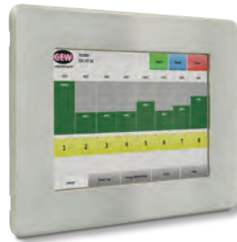
Die RHINO-Touchscreen mit dem Bedienfeld